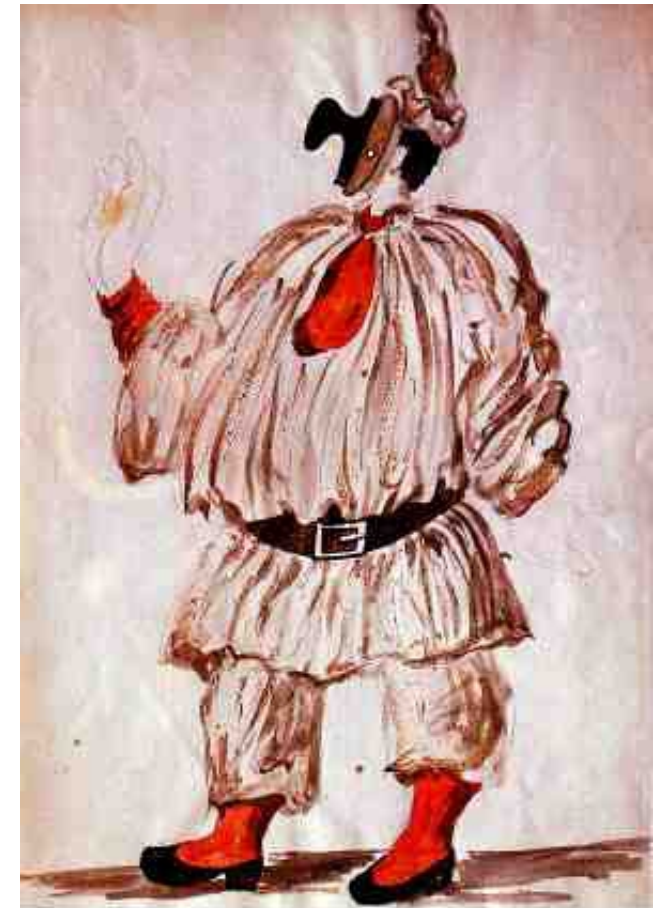
« Pulcinella » de Stravinsky - Décors et costumes de Picasso