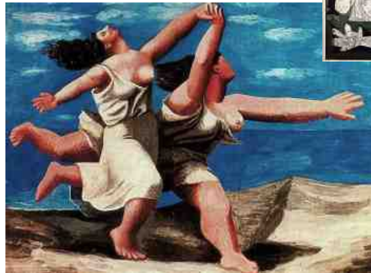
Retour au classique (1918/25)