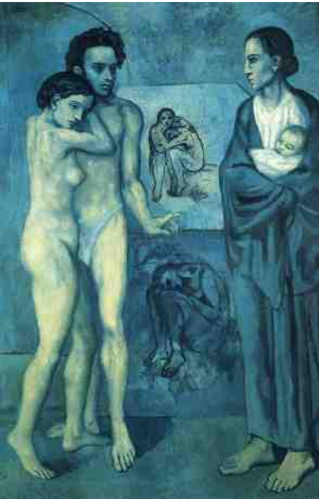
Période bleue (1901-1904)