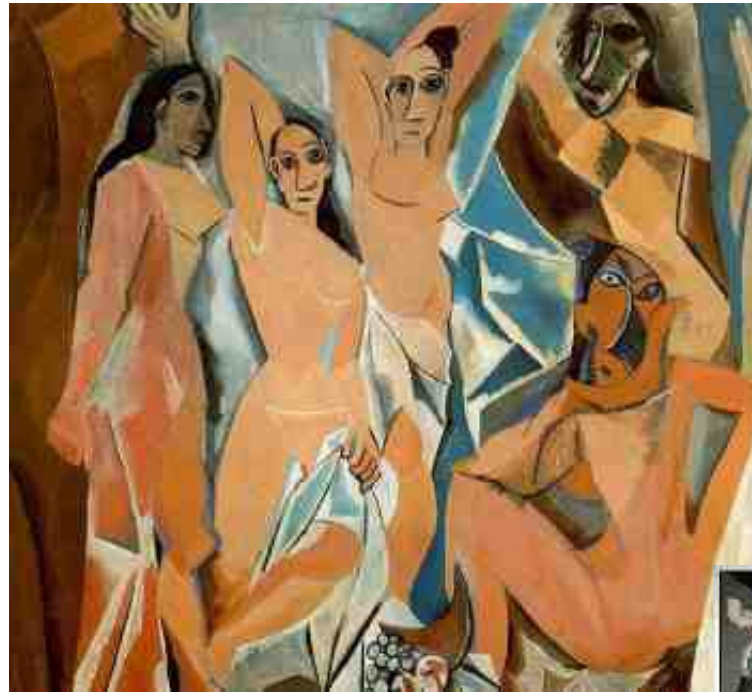
1907 : les débuts du cubisme