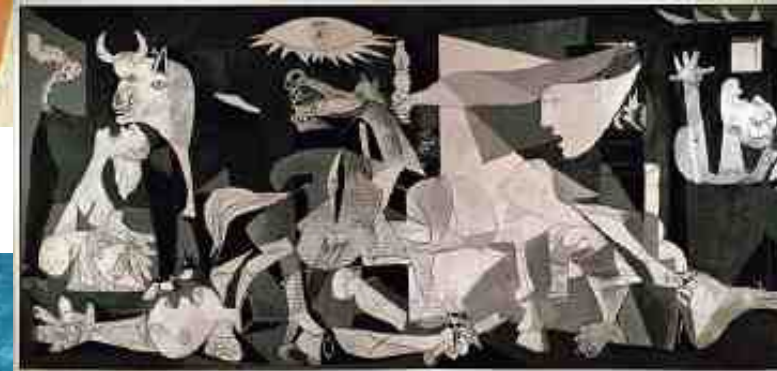
1937 : l'artiste engagé